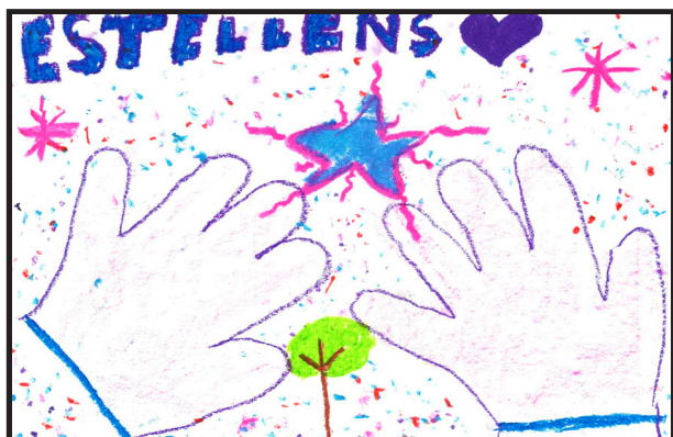
Noa Gadomeda Oliva, 7 anys.